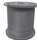
500 m-es sodrony Ø 2.4 mm H03371-1