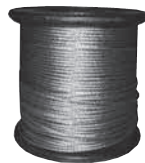
100 m-es sodrony Ø 2.4 mm H03371-0